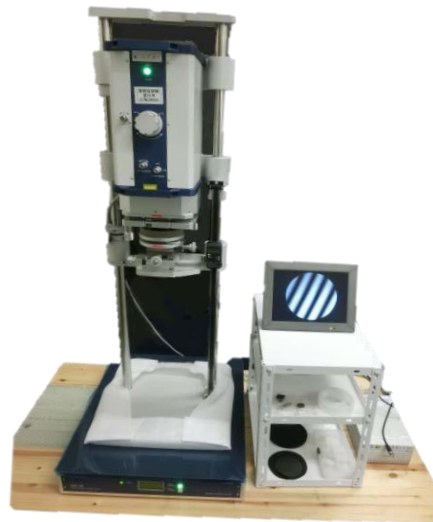
搭載干涉計的SAT-56